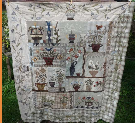
Quilt « blocs du mois 2011 » de Yoko Saïto Taille 140x155cm